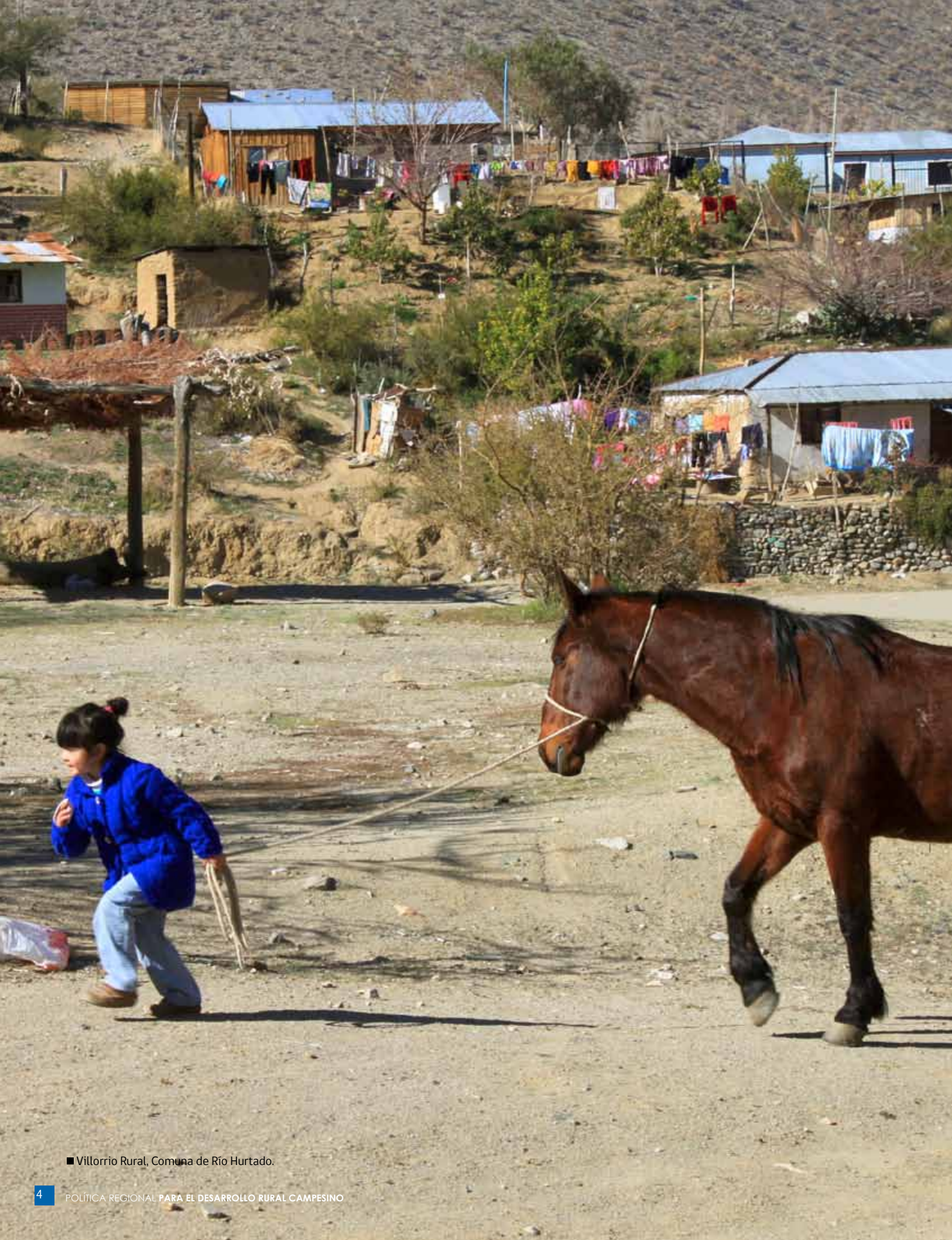
■ Villorrio Rural, Comuna de Río Hurtado.