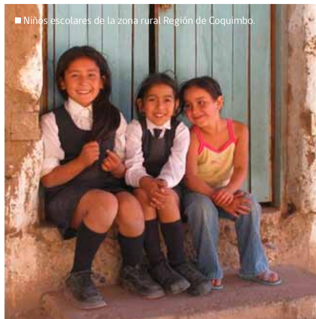
■ Niños escolares de la zona rural Región de Coquimbo.

7.2 Reconocer a la Comunidad Agrícola con una forma particular de ocupación del territorio, cuya estructura organizacional es inclusiva de las organizaciones territoriales y funcionales que existen en su territorio.