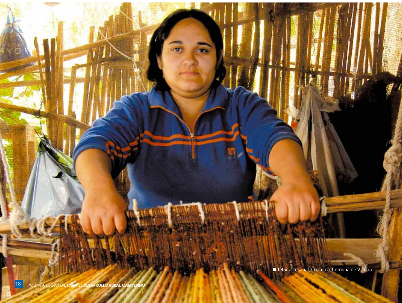
■ Telar artesanal, Chapilca, Comuna de Vicuña.

Se viene un desafío más fuerte. Pues hacer operativa esta política requiere duplicar los esfuerzos de todos los integrantes de la Mesa Regional Rural, situación que merece dedicación, participación, capacidad de consenso y respeto, todo en beneficio de la población rural de nuestra Región de Coquimbo.