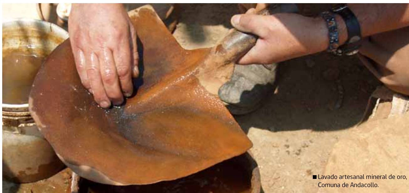
■ Lavado artesanal mineral de oro, Comuna de Andacollo.

La integración lograda a través de la discusión y generación de la presente política regional, ha permitido conformar una base de trabajo y confianza entre el ámbito público, representado por el Gobierno Regional y Municipios Rurales, y el Mundo Rural, representado por el Consejo Regional Campesino. En una segunda instancia de coordinación, dicha base deberá ser la principal precursora de