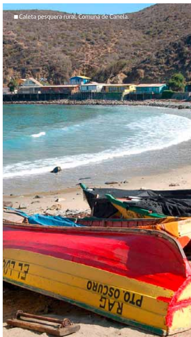
■ Caleta pesquera rural, Comuna de Canela.