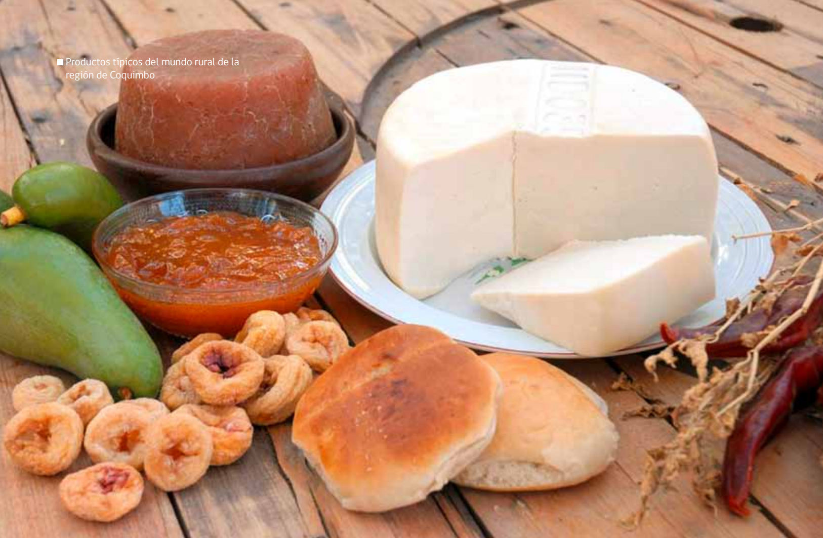
■ Productos típicos del mundo rural de la región de Coquimbo