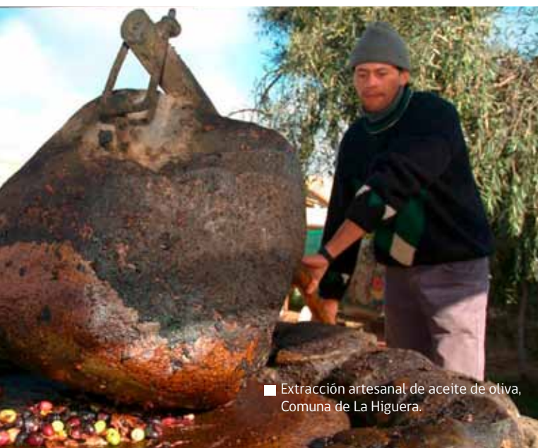
■ Extracción artesanal de aceite de oliva, Comuna de La Higuera.

5.3 Dotar de energía eléctrica de red o de sistemas alternativos (eólicos, solares) a todas las localidades rurales, a fin de facilitar el emprendimiento de actividades productivas.