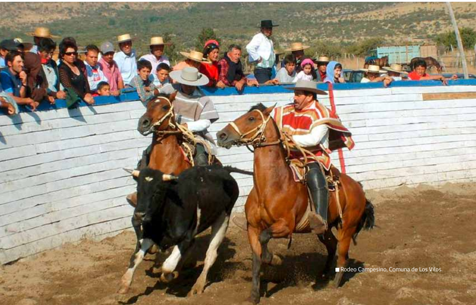
■ Rodeo Campesino, Comuna de Los Vilos.